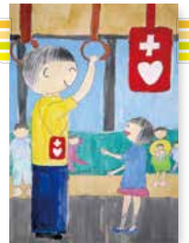
平成29年度小学生部門最優秀作品

障がいのある人となしの人との心のふれあい体験をつづった作文と、障がいのある人に対する理解を広げるためのポスターを募集します。