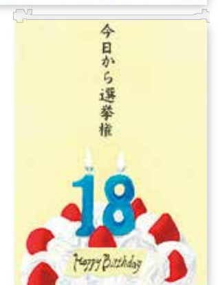
平成29年度明るい選挙啓発ポスターコンクール 文部科学大臣・総務大臣賞作品

申込み 9月7日までにポスターは作品の裏面に、習字は作品の裏面左下に紙を貼り、住所、氏名、性別、学校名・学年を書いて、持参か郵送で〒860-8601選挙管理委員会事務局(住友生命ビル9階 ☎096-328-2771)へ