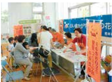
「歯の祭典」で活動する中央区8020推進員

期間 8月24日(金)開始(全4回) 場所 健康センター大江分室(ウエルパルクまもと3階)ほか 内容 口腔や全身の健康など健康づくりに関する講話や実習など 対象 中央区に住む18歳以上の方で、育成講座に毎回参加でき、修了後「8020推進員」として地域で健康づくり活動ができる方 定員 20人(先着順) 申込み 8月6日から電話で中央区役所保健子ども課へ