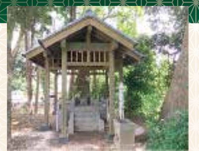
小楠公園内にある髪塚