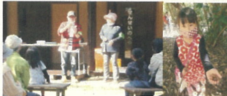
10/25ネイチャア・フィーリング