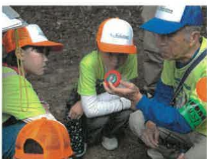
熱心に説明を聞いています