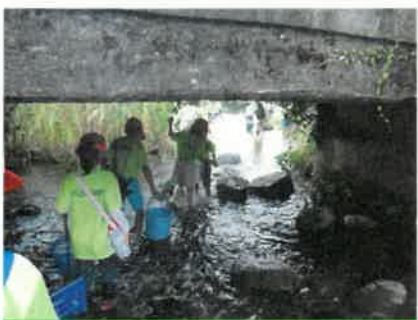
橋の下をくぐって・・・