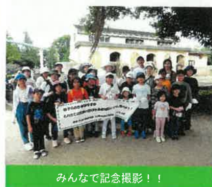
みんなで記念撮影!!