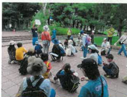
ゾウと地下水について学習