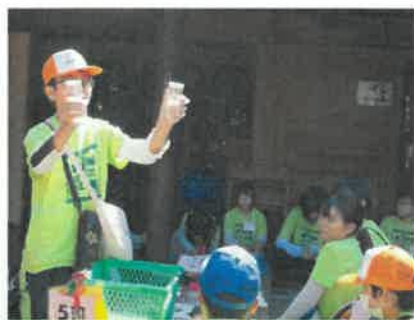
観察まとめ後の発表の様子