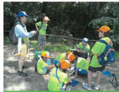
観察した生きものを発表します