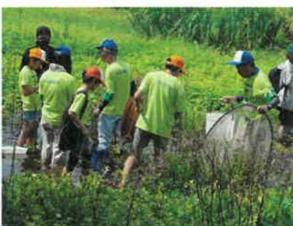
水辺にはどんな生きものがあるかな