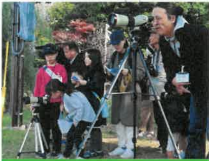
双眼鏡や望遠鏡を使って観察

日 時：令和5年12月3日（日曜日）10：00～12：00 場 所：上江津湖（熊本市） 参加者：20名