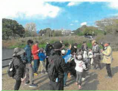
観察した鳥の鳥合わせ