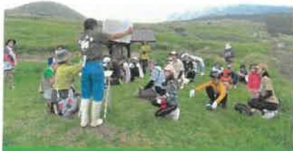
阿蘇の自然環境について学習