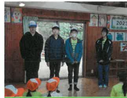
ボランティアの学生たち