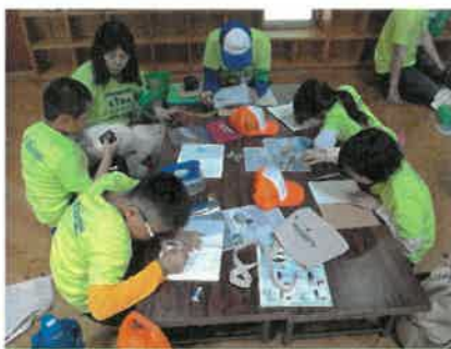
観察した生きものの記録の時間です