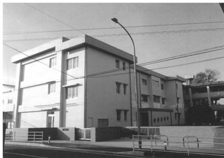
【託麻東小学校校舎】