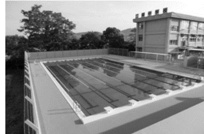
【二岡中学校プール】