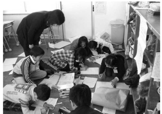
令和元年度小学校における総合的な学習の時間のテーマ

また、授業研究会における先進的な取組の周知や、実践事例集の活用指導等によって、市全体の学習内容の質的向上を図っている。