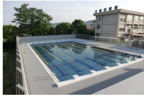
【二岡中学校プール】