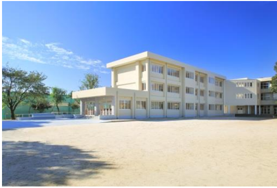
【託麻南小学校校舎】