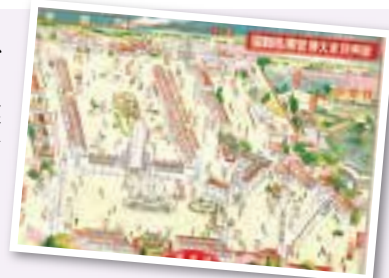
「新興熊本大博覧会鳥瞰図」

の入場者数は105万8,172人で、当時の熊本市の人口の5倍近い人々が会場に訪れました。名実ともに「産業立市」を目指す本市の成果を全国に広めた博覧会でした。