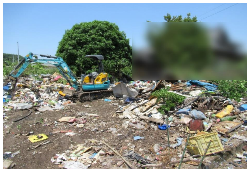
地元建設会社から貸し出し を受けた重機での作業