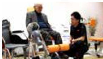
豊富なトレーニングマシン