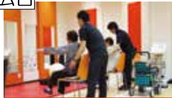
理学療法士によるトレーニング