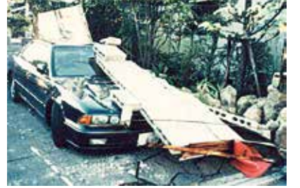
▲全国建築コンクリートブロック工業会ホームページより