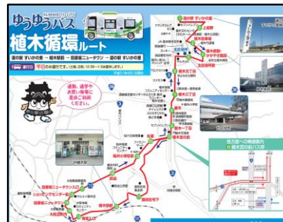
▲ゆうゆうバス運行ルート図