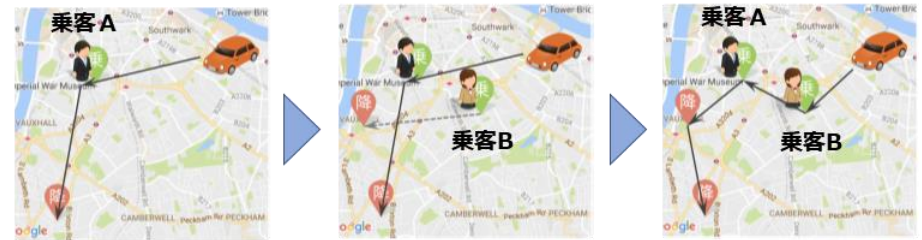
① 乗客Aから迎車依頼 ② 別の乗客Bから迎車依頼 ③ AIがルート計算乗客ABが相乗り