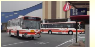
▲イオンモール熊本クレア