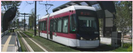
▲超低床電車 熊本市交通局