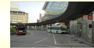
▲ハスターミナル(金沢)