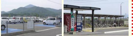
▲パーク&ライト・サイクル&ライト(西部車庫)