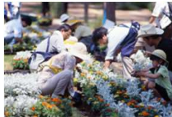
茨城県 つくばガーデニングクラブ