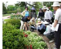
とちぎフェア 花と緑リーダー養成講座