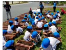
山口フェア たねだんごプロジェクト