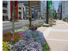
群馬フェア 高崎市まちなか緑化

緑化に対する意識は、地域によって異なっており、これを高めていくことで、道路や公園などの地域にある花壇や緑地帯を市民の手で良好に保つ仕組みづくり。