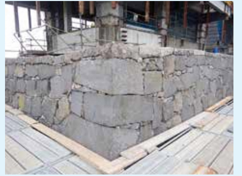
小天守北西角石垣積み直し後の様子