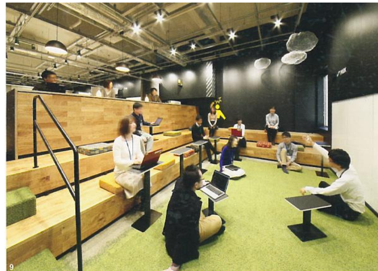
イベントスペース