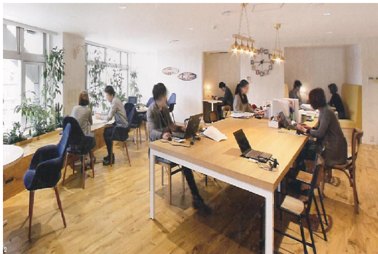
コワーキングスペース