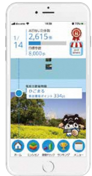
※画面はイメージです。

熊本健康アプリ「もっと健康!げんき!アップくまもと」は、「歩く」など日々の健康づくり活動を行うことでポイントが付与され、ポイントが貯まると市内のお店等で特典を受けることができるアプリです。無理せず楽しみながら生活習慣の改善につなげ、市民皆さんの健康増進や健康寿命の延伸を図ることを目的としています。