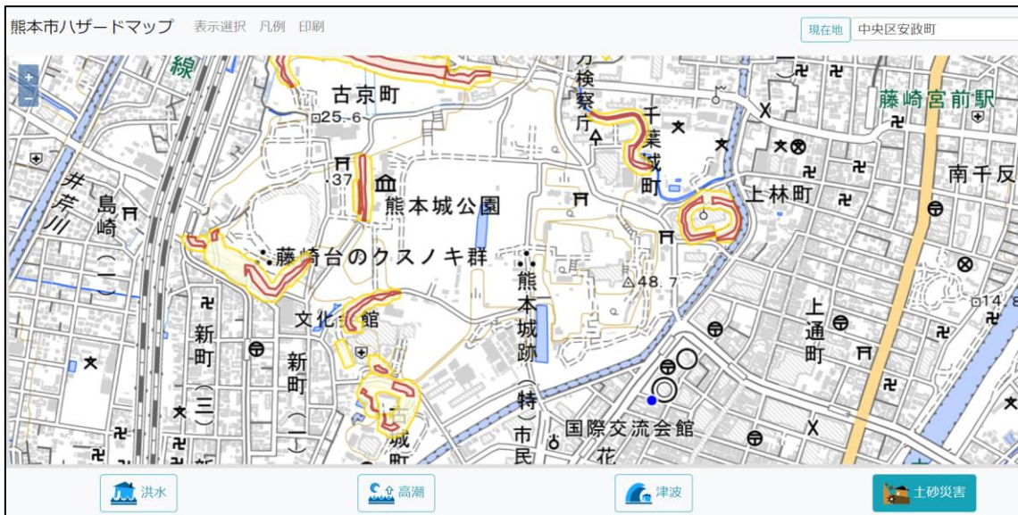
図4.土砂災害ハザードマップ (ハザードマップ操作…土砂災害を選択)

熊本県が令和4年8月に土砂災害警戒区域等を更新したことに伴い、本市の土砂災害ハザードマップも更新しました。