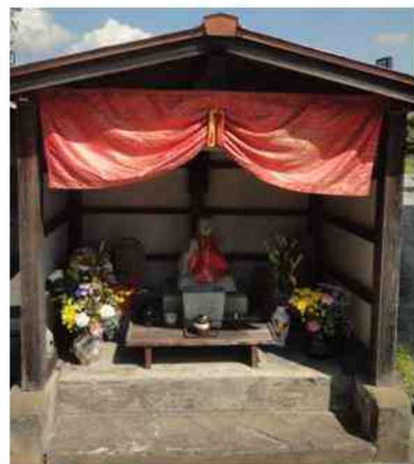
校区内の歴史・史跡等