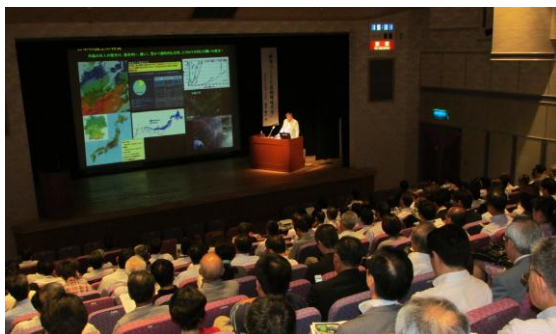
第 4 回講演会