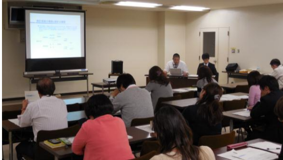
第 4 回研修会