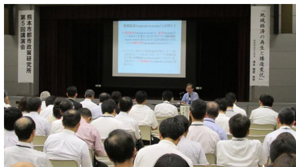
第 5 回講演会