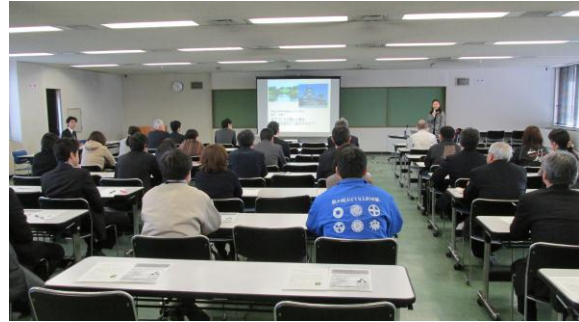
第 5 回研修会