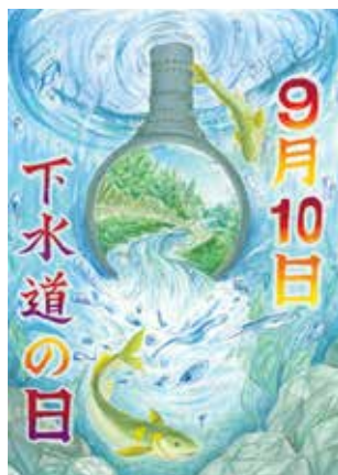
令和元年度中学生の部 特選作品