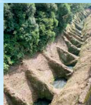
鼻ぐり井手

加藤家や細川家によって築造された白川流域かんがい用水群(上井手用水、下井手用水、馬場楠井手用水、渡鹿用水)(頭首工および水路)が、2018年8月、カナダで開催された国際かんがい排水委員会(ICID)で認定・登録されました。