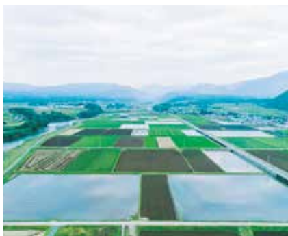
白川中流域(大津町・菊陽町など)

白川中流域の水田は、地元では「ザル田」と呼ばれるほど水が浸透しやすい土壌です。現在、作物の作付け前や収穫後の畑に水を張る「地下水かん養事業」に約300戸の農家が協力しており、年間1,000万㎡を超える地下水のかん養につながっています。1カ月分の1世帯あたりの水道使用量は約20㎡~30㎡ですから、この取り組みで約50万世帯の1カ月分の水道水を賄っていると言えます。