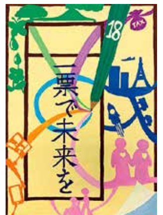
令和元年度明るい選挙啓発 作品コンクール 優秀賞