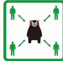
くっつかないモン #KeepDistance