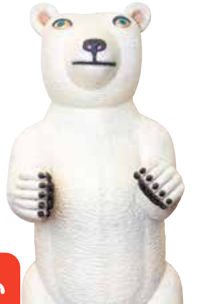
「Animal2008-03」三沢 厚彦 作