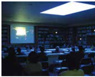
上映開始時刻/①午後2時～、②午後5時～(要事前申込) 事前予約など詳しくはHPまたは13ページをチェック

「市民に近い美術館」をめざし、学芸員がセレクトした名作・秀作ビデオの上映会「月曜ロードショー」を開催。