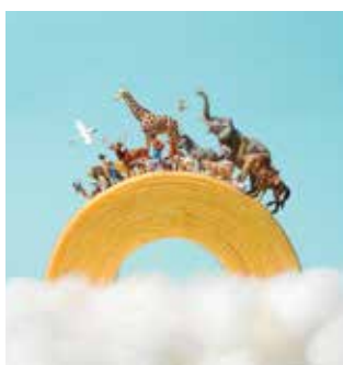
田中 達也《お菓子な虹》2019年 ©Tatsuya Tanaka

MINIATURE LIFE展2 —田中達也 見立ての世界— ■1月29日(金)～3月14日(日)