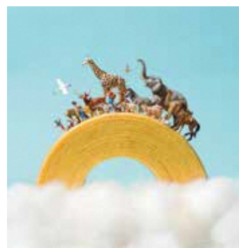
田中 達也(お菓子な虹)2019年 ©Tatsuya Tanaka

バウムクーヘンを虹に、ごはんを大空に浮かぶ雲に…。日常にある物を、別の物に見立てて、ジオラマ用人形と組み合わせた、ユニークな写真と立体作品の展覧会です。