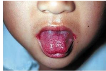
国立感染症研究所 「A群溶血性レンサ球菌咽頭炎とは」より