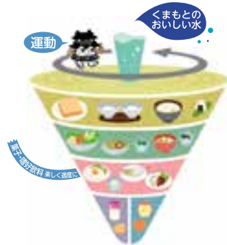
このコマは厚生労働省・農林水産省が決定した「食事バランスガイド」に基づき、熊本市食事バランスガイド普及実行委員会が作成したものです。