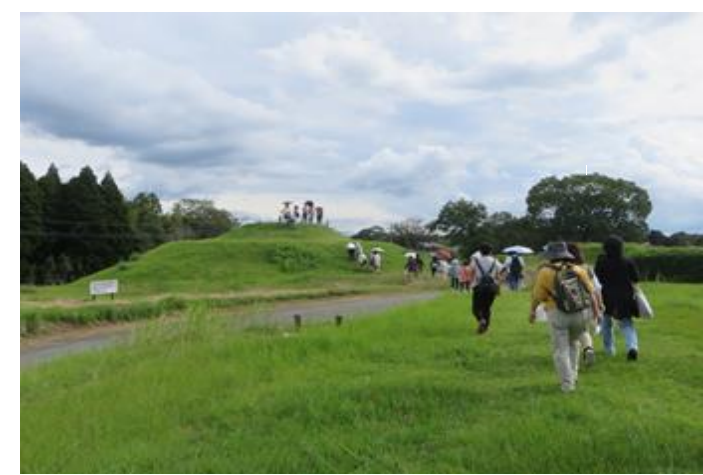
南区の魅力発見バスツアー