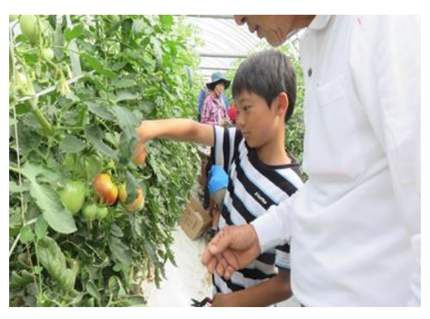
おいしいもの収穫体験・料理教室ツアー