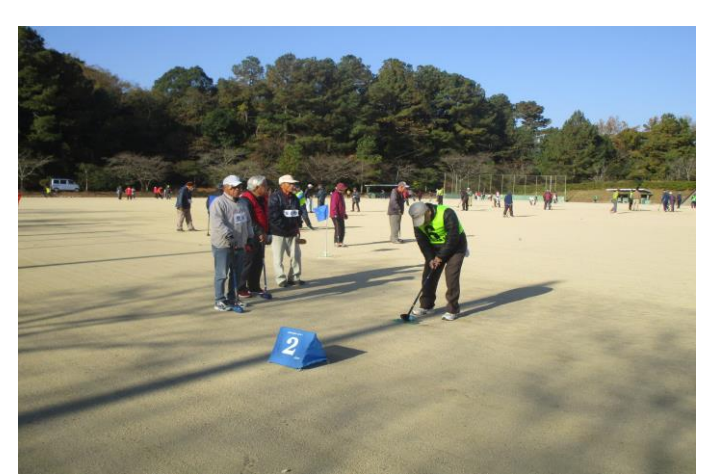
南区“いきいき”スポーツ大会