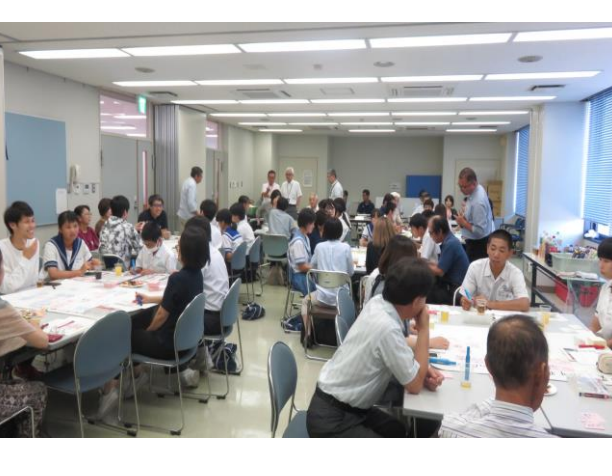
南区まちづくり懇話会