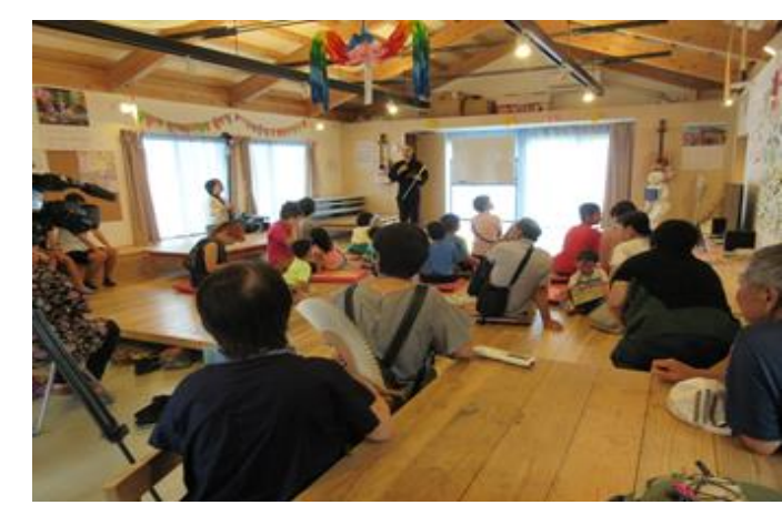
南区防災バスツアー