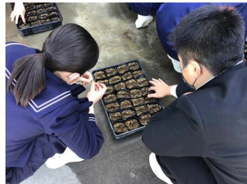
こぼれ種・採集した種からの一人一株のポットの育成