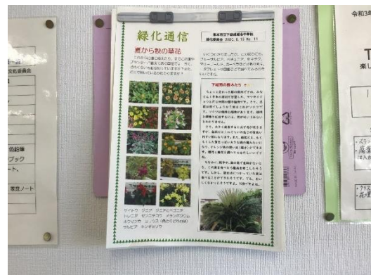
月2回の緑化通信の発行で緑化への関心を高める