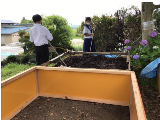
落ち葉からの堆肥作りも生徒の手で