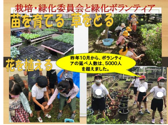
命をつなぐ緑化活動