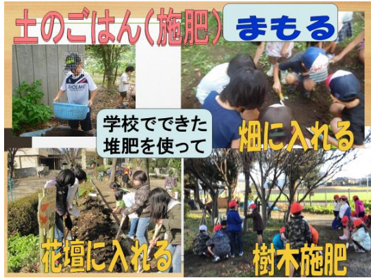
自然の力で作った腐葉土の利用