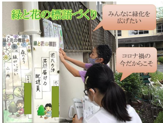
緑と花の標語づくり