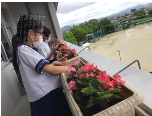
各学級のベランダにプランターを設置