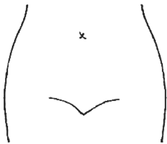
(ストマ及びびらんの部位等を図示)