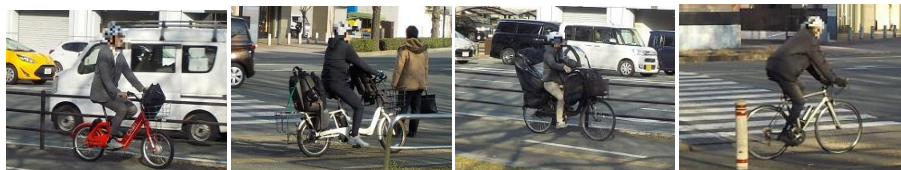
シェアサイクル 電動アシスト自転車 子乗せ自転車 スポーツバイク