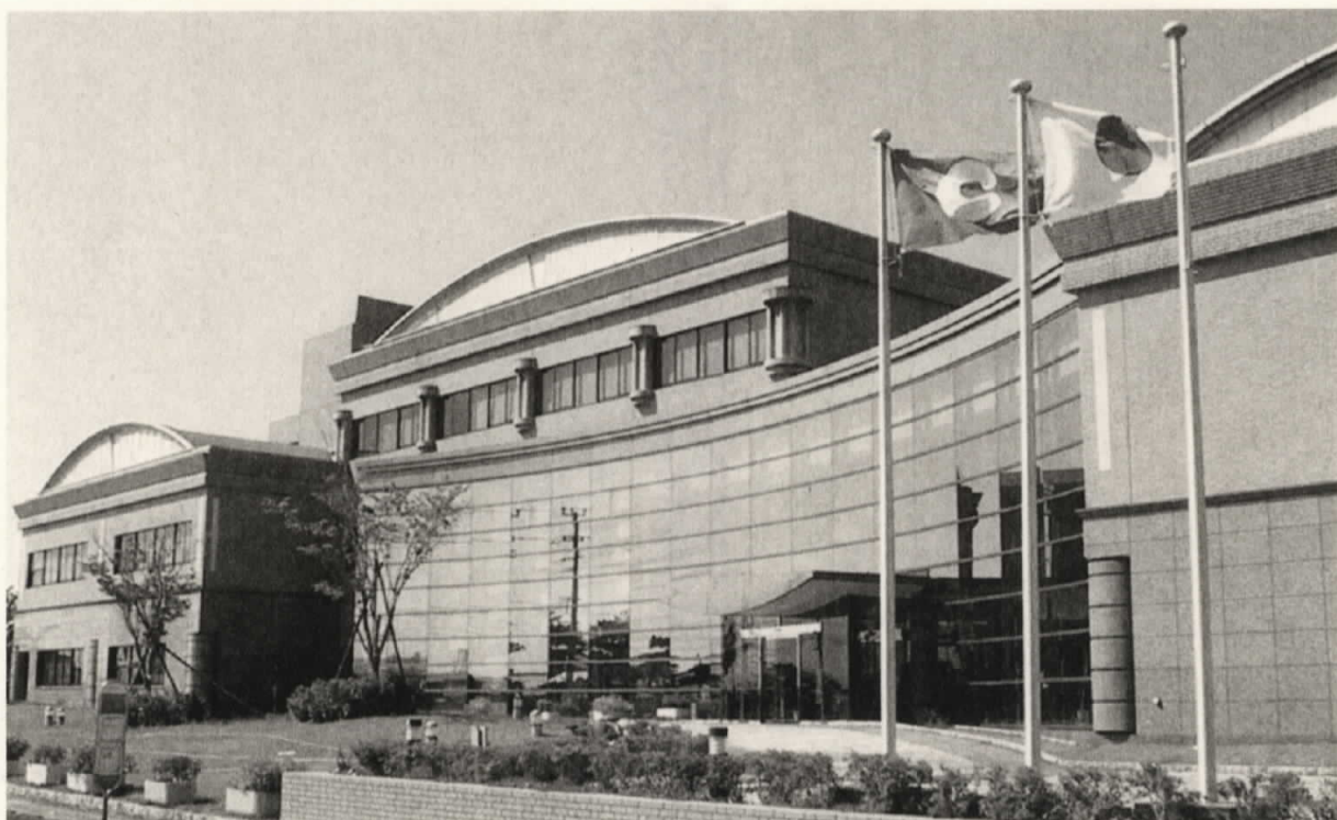
熊本市環境総合センターの全景