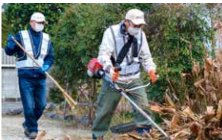
元気な高齢者4人による「黒髪4町内地域お助け隊」(中央区)の活動風景

「介護や支援はまだ必要ない」というお元気な方は、支援者として地域の支え合い活動に参加しませんか？