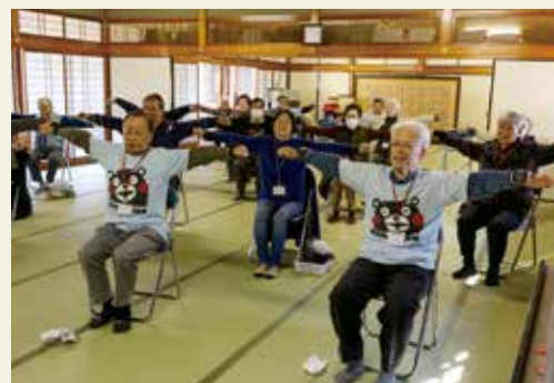
くまもと元気くらぶ「野田町優友会」(南区)が開催している体操教室