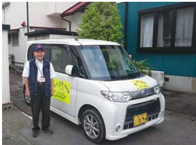
山ノ内校区の訪問・移動支援サービス「暮らし支援協力隊」(東区)