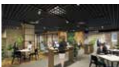
〈起業家支援スペース〉

新たなビジネス支援施設として、従来のスモールビジネス中心の創業支援に加え、「XOSS POINT.」を中心とした関係者コミュニティ形成などを通じ、首都圏等のスタートアップ等の呼び込みや、次代の熊本の産業の担い手となる起業家の発掘、育成、新規事業の立ち上げ等の支援を実施します。