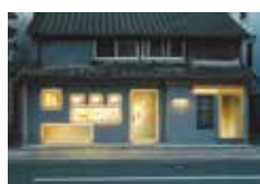
町屋の利活用の状況

また、歴史的建造物が集積する「唐人町通り」では、にぎわいや回遊・滞留につなげる道路空間のデザイン見直しを検討するなど、官民一体で魅力的な町並み景観を目指しています。