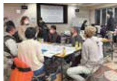
唐人町通りみちづくりワークショップの様子