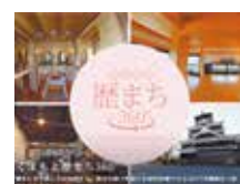
プロモーション動画サイト「くまもと歴まち360°」

そのほか、ポータルサイト「くまもと歴まち.com」や公式Instagramを開設し、歴史まちづくりに関する継続的でタイムリーな情報を発信しています。