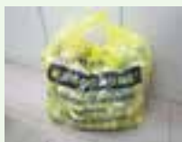
持ち去り禁止意思表示袋のイメージ