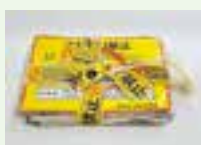
持ち去り禁止意思表示テープのイメージ