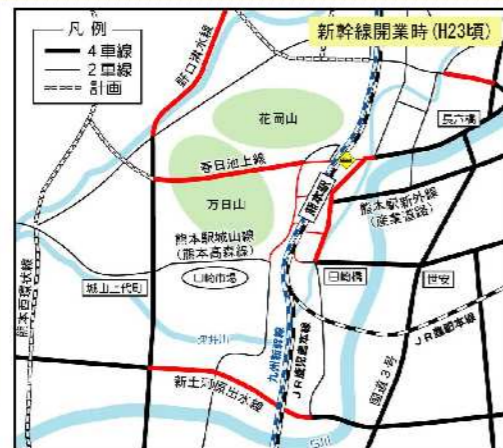
※赤線は、新幹線開業時（H23頃）迄の整備予定区間

熊本駅周辺地区の整備とともに、関連する都市計画道路網の整備を推進します。これらの都市計画道路網の整備を行うことで、熊本駅周辺地区内に流入している通過交通の転換を図り、駅前交差点における混雑を解消し円滑な交通処理を実現していきます。