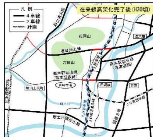
※赤線は、在来線高架化完了後（H30頃）迄の整備予定区間