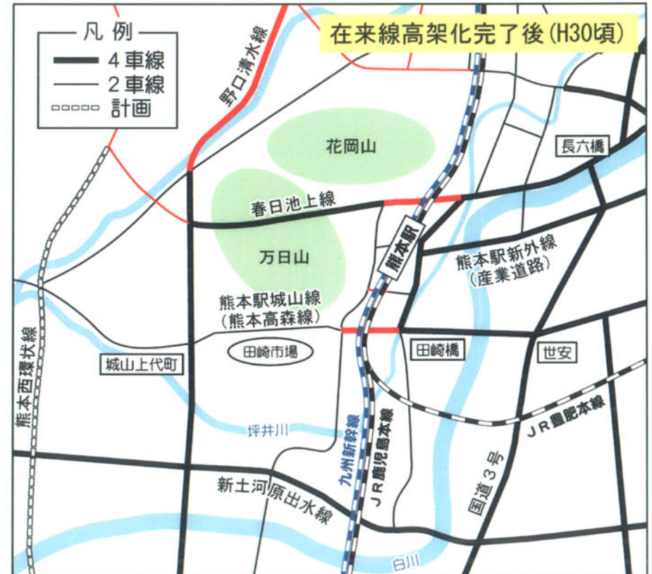
※赤線は、在来線高架化完了後 (H30 頃) 迄の整備予定区間