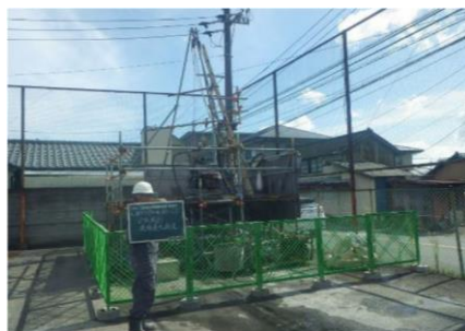
⑧地区 地質調査状況

③、⑤、⑧、①地区において、工事発注に向けて測量、地質調査、設計を実施しています。