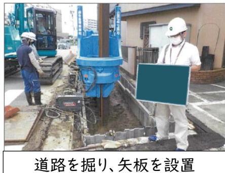
道路を掘り、矢板を設置

②地区と⑥地区では、地下水位低下工法の遮水鋼矢板(以下、矢板)設置工事が始まっております。写真のように、道路を掘り矢板を設置しますので、交通規制等を行い安全に留意しながら施工しています。また、矢板設置工事に伴い、事前連絡のうえ一時的に水道、下水道管等を止めさせていただく場合があります。