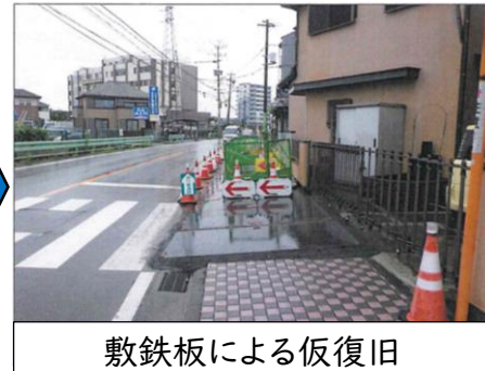
敷鉄板による仮復旧