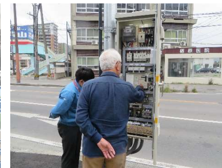
写真3. ポンプの起動(③地区)