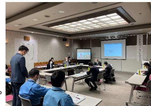
写真1. 技術検討委員会