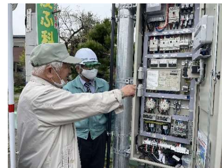
写真2. ポンプの起動(②地区)