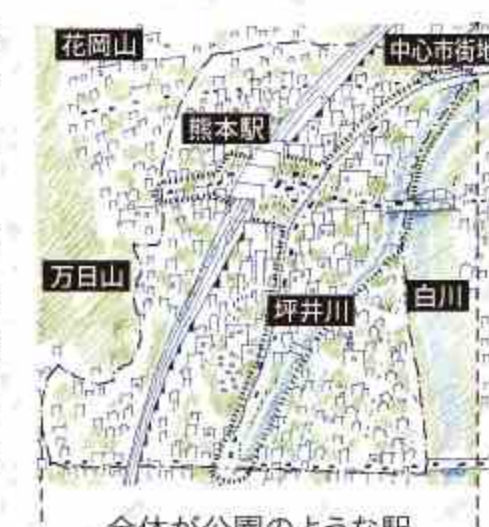
全体が公園のような駅

熊本駅周辺地域では、魅力的でにぎわいのある県都の陸の玄関口を実現するために、平成30年度までの長期間にわたり様々な整備が実施されています。「熊本駅周辺地域整備基本計画(平成17年)」では、水と緑の自然や歴史性を活かし、人にやさしく利便性の高い駅周辺空間やまちづくりを行っていくことが示され、「パークステーション」というコンセプトが掲げられました。