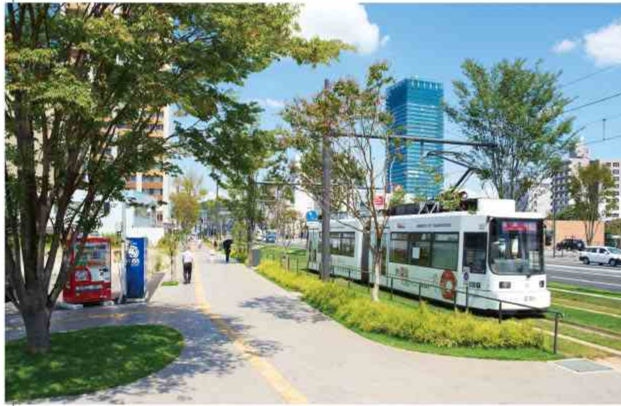
□ 熊本駅城山線【木立の景】