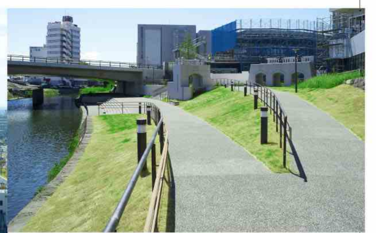
□ 水辺広場【水辺の景】