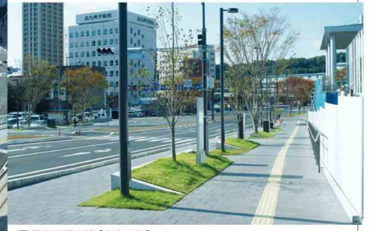
□ 熊本駅帯山線【出会の景】