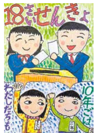
令和3年度明るい選挙啓発作品コンクール特別賞

申し込み 9月8日までに作品に、住所、氏名(ふりがな)、電話番号、学校名・学年を書いた紙を添えて、持参する場合は中央区花畑町9-24住友生命熊本ビル9階へ、郵送する場合は〒860-8601選挙管理委員会事務局へ (選挙管理委員会事務局 ☎096-328-2771)