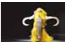
MAMMOTHの衣装で踊る藤村港平 2020

時 午前10時～午後8時(入場は午後7時半まで) 場 現代美術館 ギャラリーⅠ・Ⅱ 費 一般1,300円、シニア(65歳以上)1,000円、学生(高校生以上)800円 ※中学生以下・各種障害者手帳をご提示の方と付き添いの方1人無料 ※火曜日休館 (現代美術館 ☎278-7500)