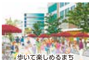
歩いて楽しめるまち