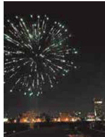
(西部まちづくりセンター ☎329-7625)