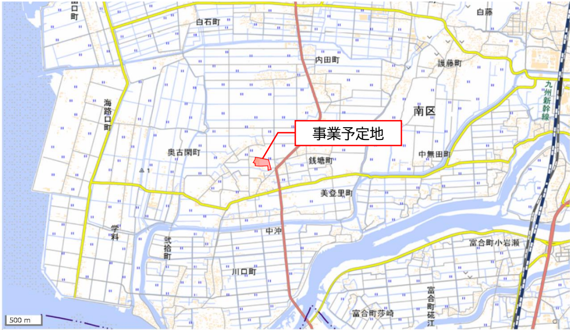
図 1 事業予定地位置図