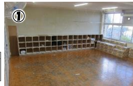
特活 (多目的) 室 (64㎡)