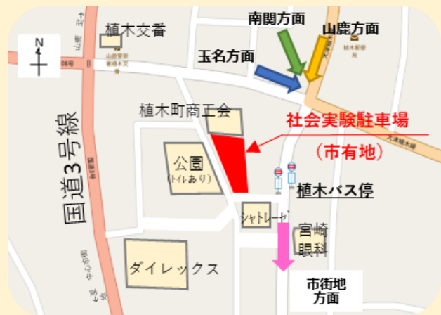
植木バス停周辺地図

途中で公共交通機関に乗り換えることにより、 ガソリン代の節約 ができます。 また* おでかけICカード を使えば 運賃が割引 になりさらにお得！ *熊本市にお住まいの70歳以上の高齢者または障がい者の方に対して交付している交通系ICカード