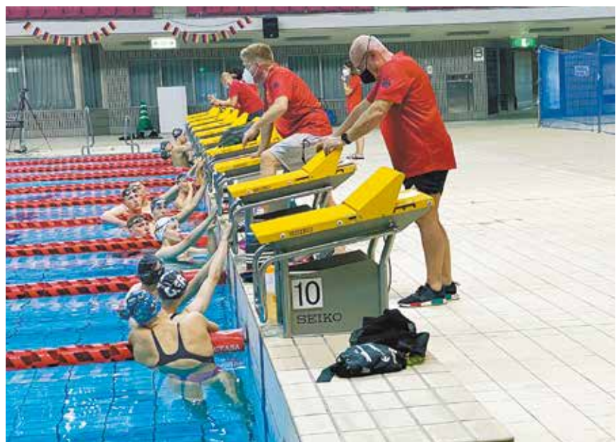
前回の合宿の様子