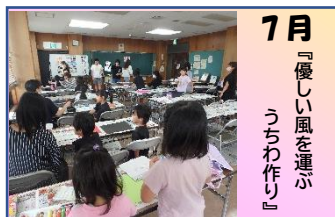
7月 『優しい風を運ぶうちわ作り』