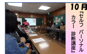
10月 『セルフパーソナルカラー診断講座』