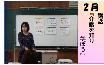
2月 講話 『介護を知り学ぼう!』

各学校の運営委員で、保護者が楽しく交流できる講座を企画立案します。4月の会議で、 親子企画 や 自分時間も大切にリフレッシュしていただきたくて 、皆さんの喜んでくれる顔を想像しながら♡楽しく和やかに年間計画を立てています。