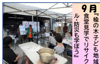
9月 『楡の木子ども地域食堂見学でリサイクル・防災も学ぼう!』