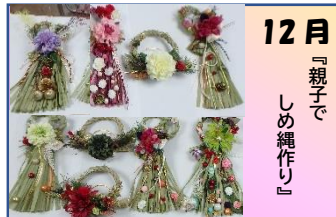
12月 『親子でしめ縄作り』