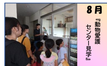
8月 『動物愛護センター見学』