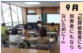
9月 『犯罪被害者にも加害者にもならないために!』