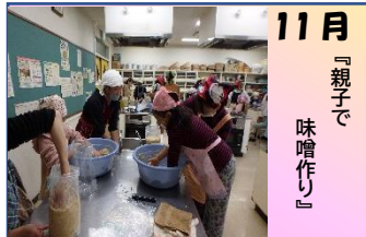
11月 『親子で味噌作り』