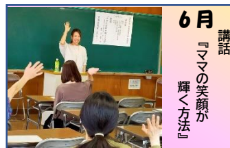
6月 講話 『ママの笑顔が輝く方法』