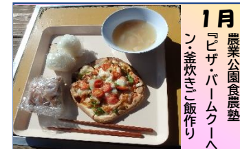
1月 農業公園食農塾 『じゃ・ぱームクーハン・釜炊きご飯作り』