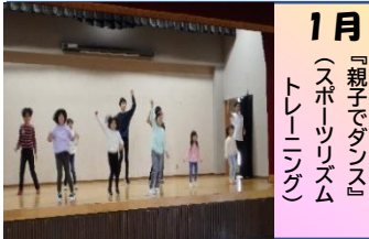
1月 『親子でダンス』(スポーツリズムトレーニング)