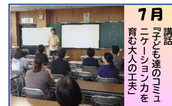
7月 講話 『子ども達のコミュニケーション力を作る大人の工夫』