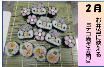
2月 『お弁当に映える』『テ』巻き寿司』